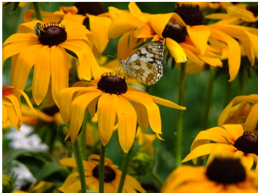
Schachbrett @ Rudbeckia hirta