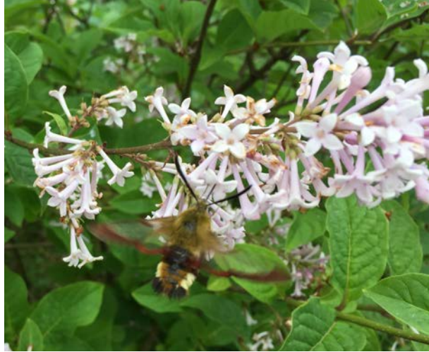
Hummelschwärmer @ Syringa reflexa

Für die nun anstehende Schmetterlingsaison 2019 haben wir uns vorgenommen, die Datenbasis durch ein zusätzliches Beobachtungsjahr weiter zu verstärken und nun auch andere tagaktive (Nacht-)falter mit in die Erhebung einzubeziehen.