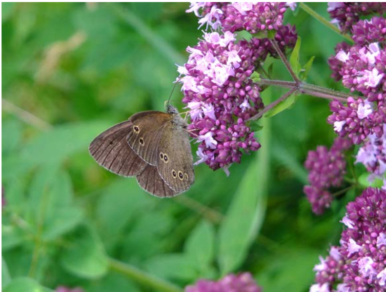
Schornsteinfeger @ Origanum vulgare

Zwischen Blüten und Schmetterlingen gibt es eine biologische Vernetzung, die Konrad Sprengel (1750-1816), der Begründer der Blütenbiologie, bereits vor langer Zeit entdeckte. Beide Seiten haben einen Nutzen: Zur Bestäubung machen die Blüten den Faltern ein attraktives Angebot: Sie werden beim Besuch der Blüten mit Nektar ‚belohnt‘ und bekommen beiläufig eine Portion Pollen mit.