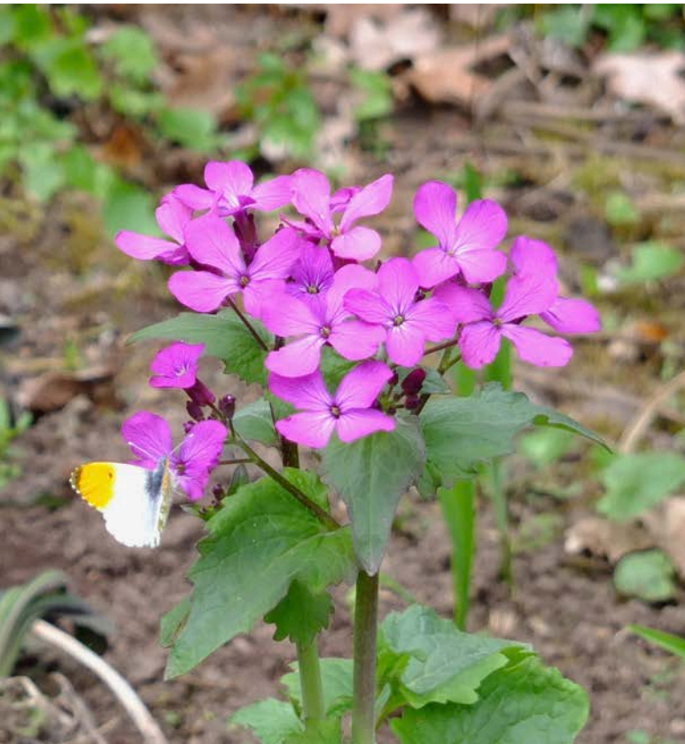
Aurorafalter @ Lunaria annua

Die Beobachtungsdaten wurden spezifisch, das heißt je Tagfalterart, Nektarpflanze sowie Kalenderwoche ausgewertet und daraus wertvolle Informationen zu den Tagfalterarten und deren saisonal variierenden Nahrungspflanzen in unserer Region gewonnen.